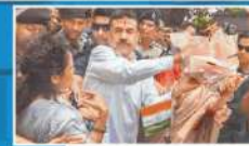
कोलकाता: 'जन्ता दरवार' कार्यक्रम के बाद प्रदेश भाजपा कार्यालय में लोगों से बातचीत करते परियोजना बंगाल के मुख्यमंत्री शुभेंदु अधिकारी।